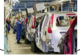
ورشة لصناعة السيارات